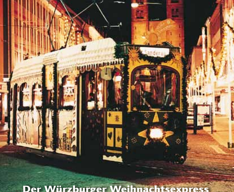
Der Würzburger Weihnachtsexpress