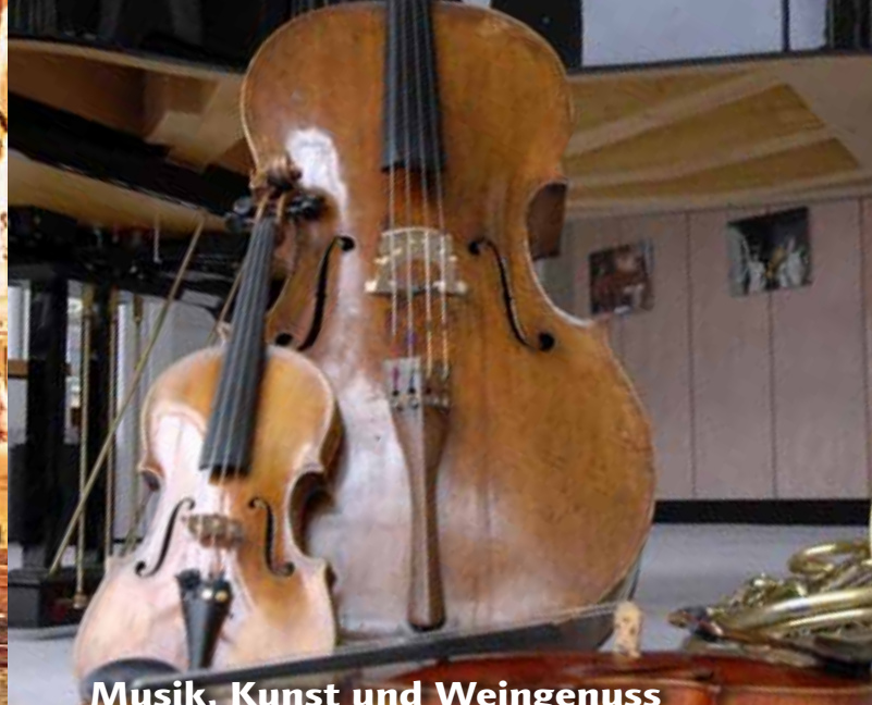
Musik, Kunst und Weingenuß